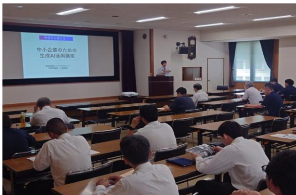
一般社団法人 松本法人会様