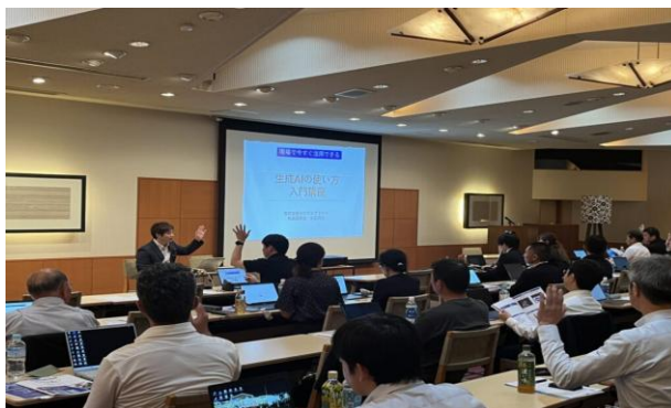
税理士任意団体 (TKC) 神奈川 湘南支部様