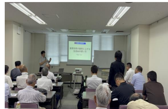
愛知県行政書士会 「尾北支部」様