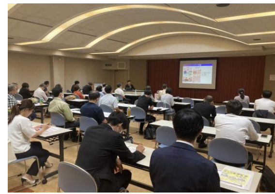
公益社団法人 名古屋北法人会